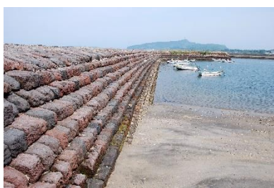
①宮ヶ浜港防波堤の築造