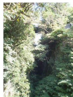
③鳥越堀切の掘削工事

32. 文久 3 年に起きた薩英戦争前夜の様子を、当時指宿地頭仮屋に勤務していた役人が記した日記から知ることができる。その役人の名前は次のうちどれか。