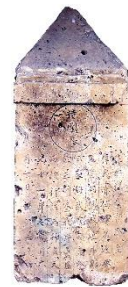
市指定文化財「板碑」