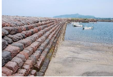
② 宮ヶ浜港防波堤の築造