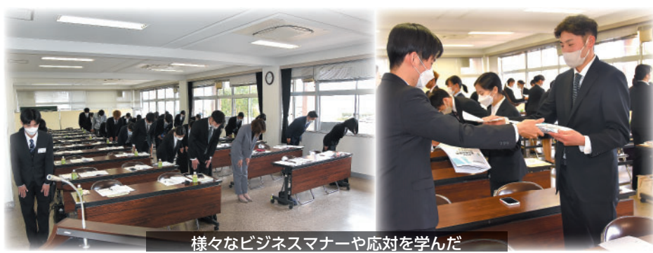
様々なビジネスマナーや応対を学んだ

て、当研修会は閉会となった。受講者は、「学生と社会人の違いを深く実感しました」「社会人として常に責任をもって行動することが重要だと感じました」と感想を述べた。