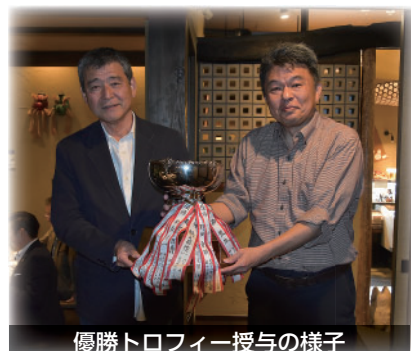
優勝トロフィー授与の様子