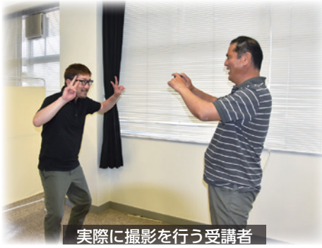
実際に撮影を行う受講者

「スマホで伝わるPR動画を作ろう!」と題して行われた当セミナーでは、動画撮影、編集、アップロードといった内容の講義であった。はじめに、動画は長いと飽きてしまうので出来るだけ短くすることや解像度・使用容量等、動画を作成する上で基本となることの説明が行われた。