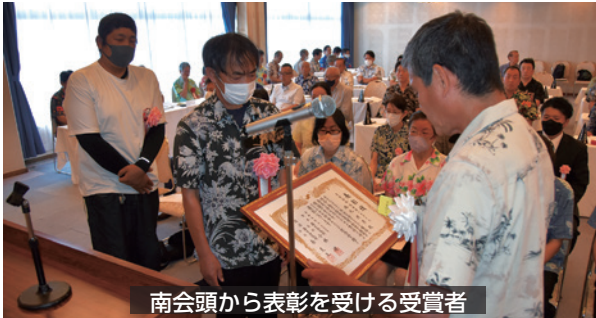
南会頭から表彰を受ける受賞者