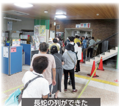
長蛇の列ができた

1万円で1万2千円分の買物をする事ができる「いぶすきプレミアム商品券」が8月6日（日）から販売開始された。