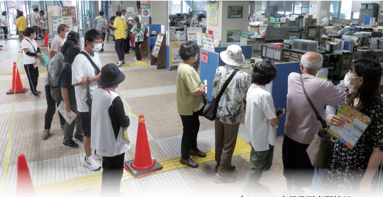
プレミアム商品券販売開始日

指宿商工会議所では、経営に関わる相談への対応をはじめ、事業計画作成・補助金申請手続の支援、販路開拓支援、セミナーや講習会・研修会の開催、融資の受付・あっせん、各種共済制度の加入など、企業経営に関する様々な事業を行っています。