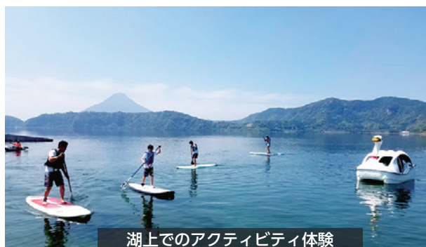
湖上でのアクティビティ体験