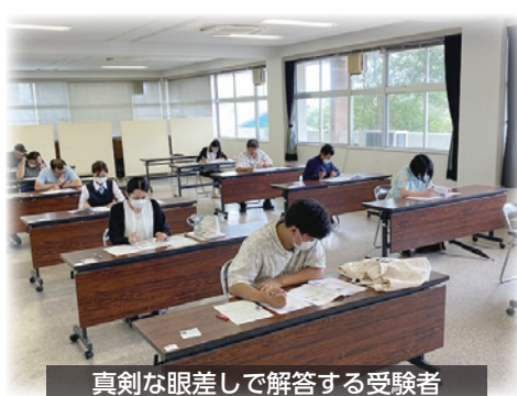
真剣な眼差しで解答する受験者

昨年から再開された当検定は、前回より受験者も増加し、指宿商業高等学校の商業マネジメント科の1年生110名にも受験していただき、再び盛り上がりを見せている。