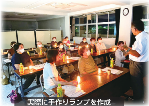
実際に手作りランプを作成

受講者は、「今日学んだことを、家に帰ってからも家族と話し合っって今後の備えにしたいと思います」と話しており、有意義なセミナーとなりました。