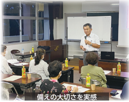
備えの大切さを実感