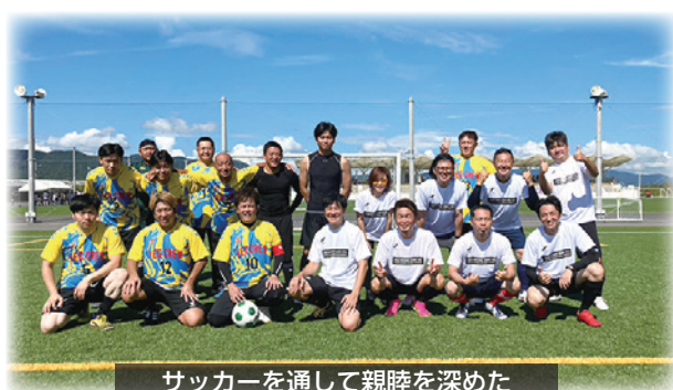
サッカーを通して親睦を深めた

結果は、1勝1敗の予選リーグ敗退という悔しい結果となりましたが、当所青年部は、大会運営と試合出場の両方を果たし、有意義な1日となりました。 大会終了後は、セントラルパークにて表彰式・大懇親会が行われました。その後は、「いぶすきバル」を開催し、それぞれの参加チームごとに分かれて、指宿の街を楽しんでもらいました。 前回大会出場から、九州各地でのキャラバンなど、1年がかりで準備が行われたサッカー事業は、大盛り上がりで幕を閉じました。