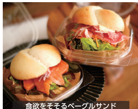
食欲をそそるベーグルサンド

並ぶからには「お土産にたくさん買っていきたい」といったお客様のニーズに応えるべく、専門店では珍しい個数制限なしで購入できるといった特徴があります。