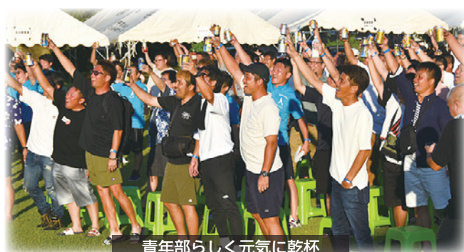
青年部らしく元気に乾杯