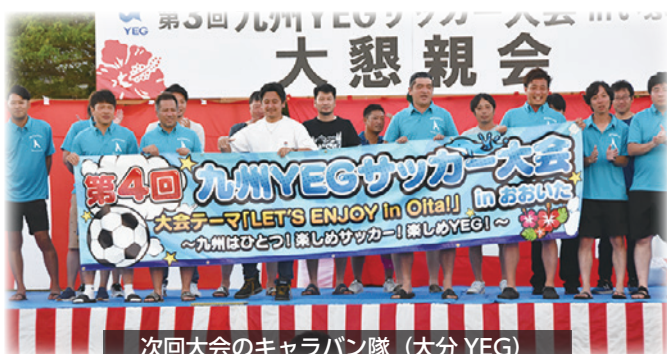
次回大会のキャラバン隊（大分 YEG）