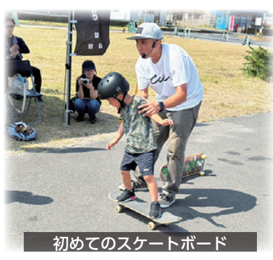
初めてのスケートボード

大人から子どもまで楽しめるスクールとなっております。スケートボードに興味のある方は是非ご参加ください。次回は、12月16日(土)の開催予定となっております。