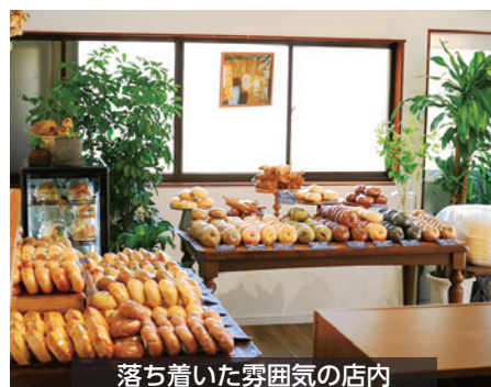
落ち着いた雰囲気の店内