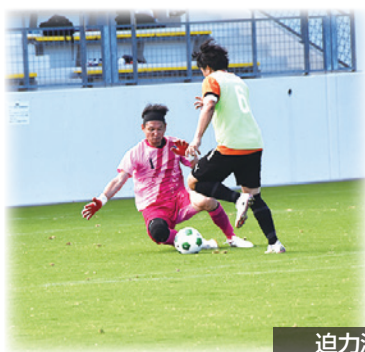
迫力満点の試合が繰り広げられた