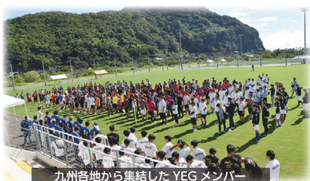
九州各地から集結した YEG メンバー

当日は、太陽が照りつける中、8人制のハーフコートで予選リーグで上位2チームが決勝トーナメントに進出する形式で試合を進行し、当所青年部も「指宿 YEG CREW」というチーム名で出場し、「九青連総務ネットワーク委員会」、前回優勝の「長崎 YEG VICTOR」と対戦しました。