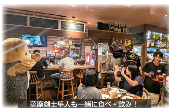
薩摩剣士隼人も一緒に食べ・飲み!

3枚つづりのチケットを購入し、チケットを1枚使用すると、店舗こだわりの1ドリリンクと1プレートを味わうことができますイベントです。今回は、鹿児島県のローカルヒーロー「薩摩剣士隼人」も一緒に参加店舗を回りイベントを盛り上げてくれました。