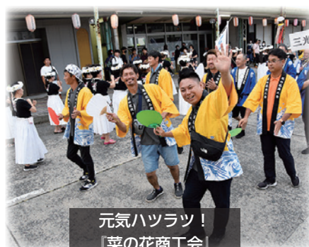
元気ハツラツ！ 『菜の花商工会』