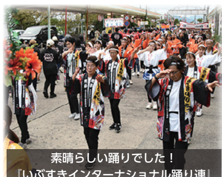
素晴らしい踊りでした！ 『いぶすきインターナショナル踊り連』