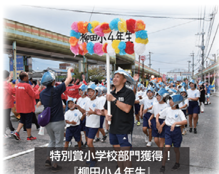
特別賞小学校部門獲得！ 『柳田小4年生』