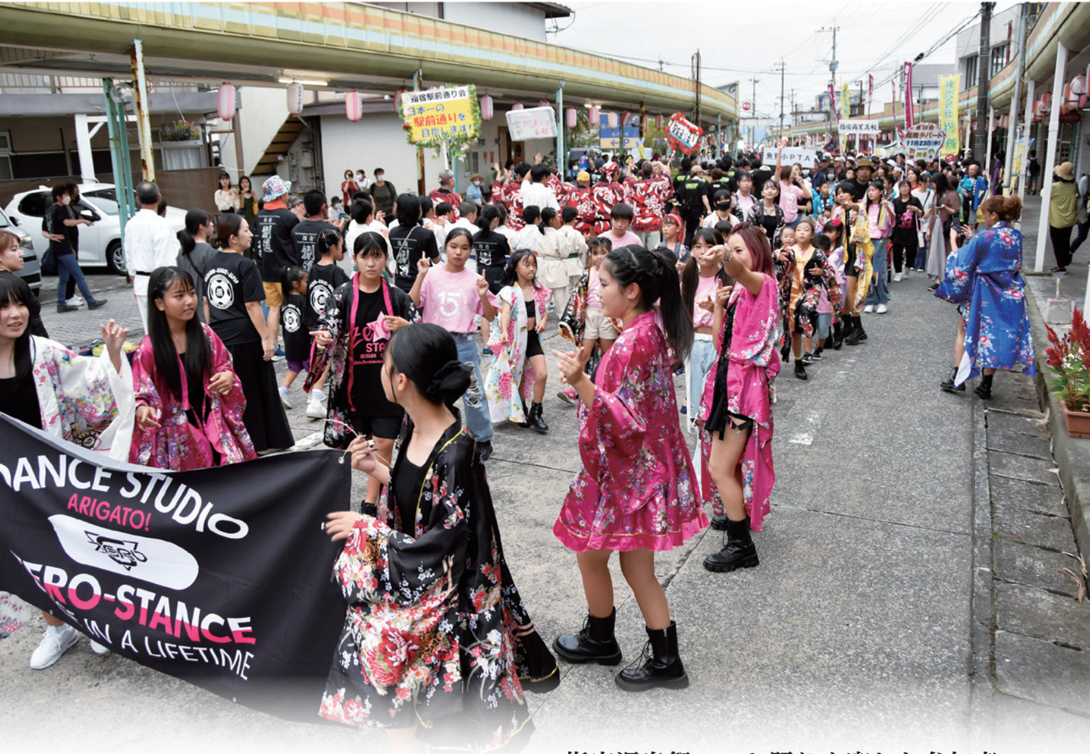
指宿温泉祭ハンヤ踊りを楽しむ参加者

指宿商工会議所では、経営に関わる相談への対応をはじめ、事業計画作成・補助金申請手続の支援、販路開拓支援、セミナーや講習会・研修会の開催、融資の受付・あっせん、各種共済制度の加入など、企業経営に関する様々な事業を行っています。