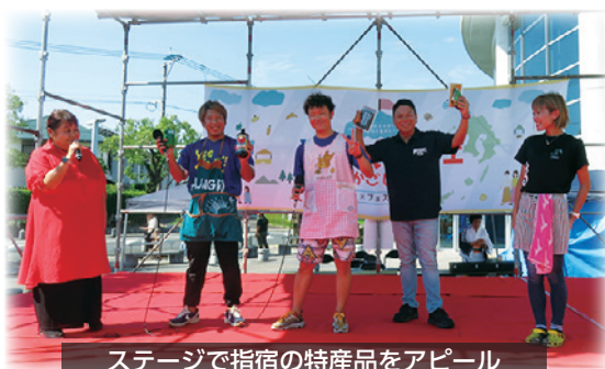
ステージで指宿の特産品をアピール