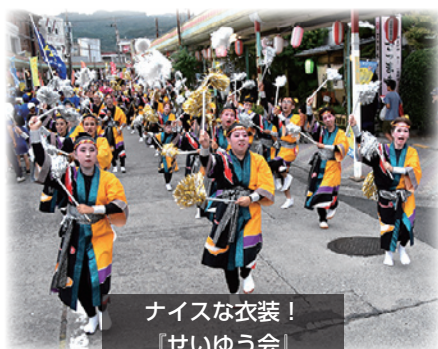
ナイスな衣装！ 『せいゆう会』