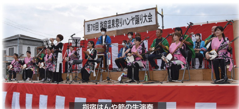
指宿はんや節の生演奏