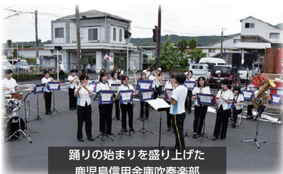
踊りの始まりを盛り上げた 鹿児島信用金庫吹奏楽部