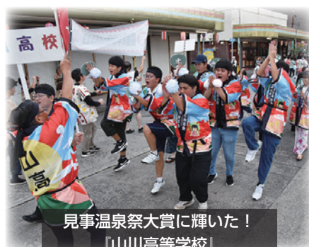
見事温泉祭大賞に輝いた！ 『山川高等学校』