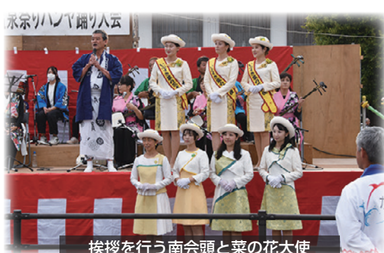
挨拶を行う南会頭と菜の花大使