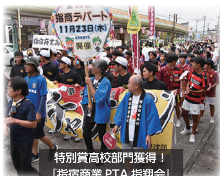
特別賞高校部門獲得！ 『指宿商業PTA 指翔会』