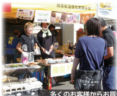
多くのお客様からお買い求めいただきました!

その他、ダンスやミュージシャンによる素晴らしいステージパフォーマンスが披露され、来場者を魅了しました。