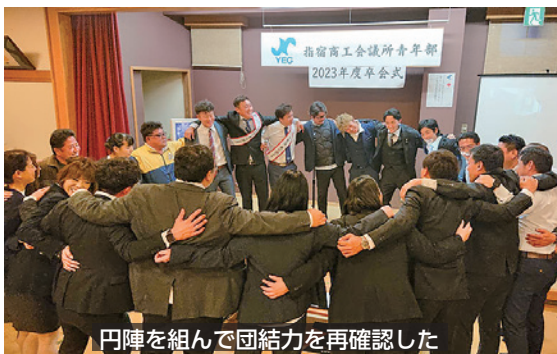
円陣を組んで団結力を再確認した

歓談中には、現役会員による青年部らしさ満載の体を張った余興や思い出の動画を流し、卒会者を楽しませまし