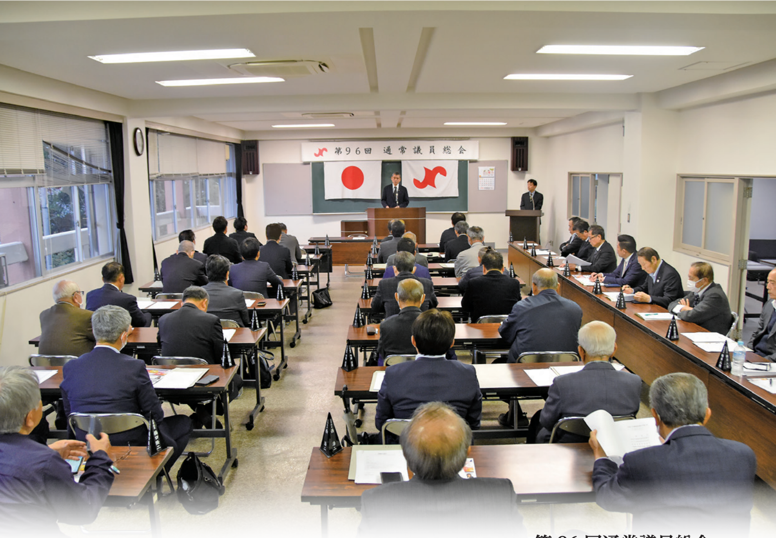
第96回通常議員総会

指宿商工会議所では、経営に関わる相談への対応をはじめ、事業計画作成・補助金申請手続の支援、販路開拓支援、セミナーや講習会・研修会の開催、融資の受付・あっせん、各種共済制度の加入など、企業経営に関する様々な事業を行っています。