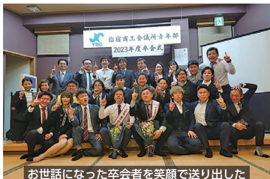
お世話になった卒会者を笑顔で送り出した

その後、卒会者表彰と記念品・花束の贈呈が行われました。最後に、卒会者より別れの言葉と激励の言葉をいただき閉会となりました。