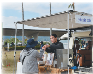
多数の事業者が出店