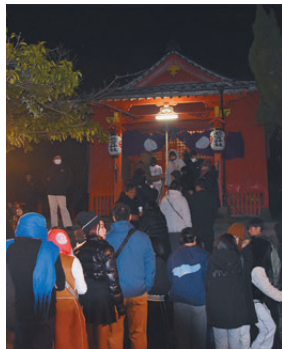
若宮神社で年越し初詣(1月)