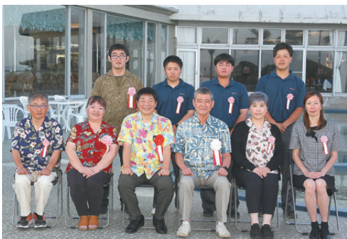
優良従業員表彰(6月)

永年にわたり勤務し、事業の発展と社業を通じて地域経済の振興に尽くした従業員を事業主の推薦を得て表彰した。