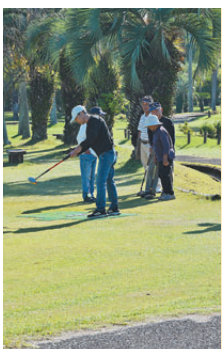
会員親睦グラウンドゴルフ大会(10月)

会員間の交流を図るためにグラウンドゴルフ大会を開催。プレーを楽しみながら参加者同士で親睦を深めた。