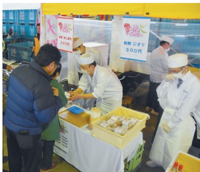
いぶすきグルメ祭り(2月・6月)

市内のホテル旅館や飲食店が指宿の旬のメニューを提供する「いぶすきグルメ祭り」を初開催。春と秋で2回実施。