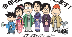
ミナミさんファミリー