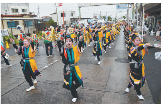
指宿温泉祭ハンヤ踊り(9月)

収集したエコキャップをリサイクルした益金で発展途上国へワクチンを届ける事業。当所女性会で取り組んでいる。