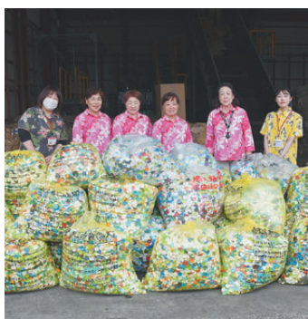
女性会エコキャップ運動(7月)

収集したエコキャップをリサイクルした益金で発展途上国へワクチンを届ける事業。当所女性会で取り組んでいる。