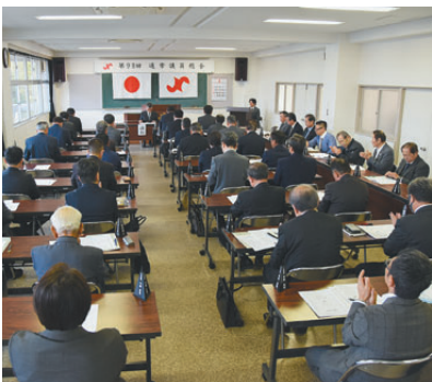
通常議員総会(3月・6月)

市内のホテル旅館や飲食店が指宿の旬のメニューを提供する「いぶすきグルメ祭り」を初開催。春と秋で2回実施。