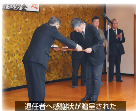
退任者へ感謝状が贈呈された

なお、要望及び回答については、会議所ニュースの別紙にて会員の皆様にお配りいたしますので、ご参照ください。