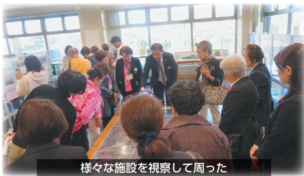
様々な施設を視察して周った

例年、講師による講演を聴講する研修会であったが、今回は視察研修となっており、女性会メンバーは、鹿屋航空基地史料館・鹿屋市観光物産総合センター・かのやばら園・くろぶたの丘の4ヶ所を視察して周りました。