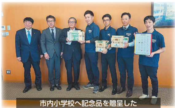
市内小学校へ記念品を贈呈した

12月4日（木）に大阪府のハービスOSAKAにて、かごしま食のバイヤーマッチング商談会in大阪が開催されました。