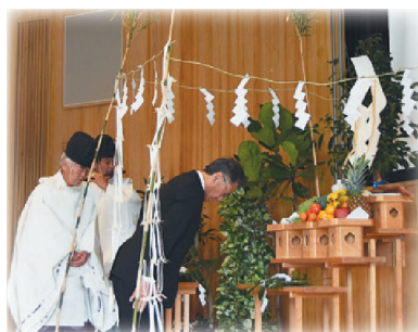
祈願祭での大山会頭