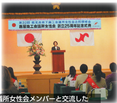
式典・交流会にて県下商工会議所女性会メンバーと交流した

令和9年度は当所女性会が開催担当となっており、開催に向けて参考になる良い機会となりました。