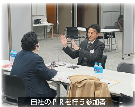
自社のPRを行う参加者

当所からは、(有)大山甚七商店・指宿酒造(株)・吉永酒造(有)・ACOUSPRITS(株)の4社が参加し、訪れるバイヤーへ自社商品の見本などを示しながらPRと商談を行いました。