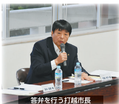
答弁を行う打越市長