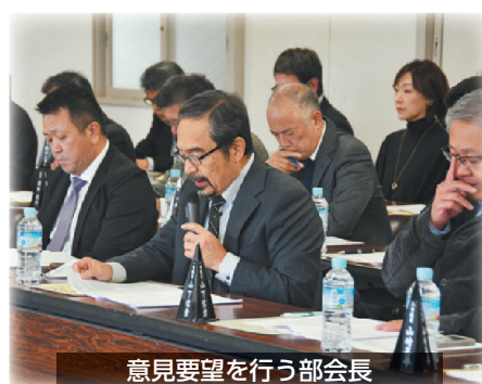
意見要望を行う部会長

12月3日(水)、当所大会議室にて、市内商工業者の意見を行政に届けるために毎年行われる、「市長との対話集会」を開催しました。 当日は、各部長や役員・議員、市からは市長をはじめ、関係部署部長ら幹部が出席しました。