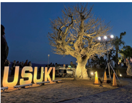
緑地帯の照明点灯を祝った

また、同日の夜には、緑地帯の一部が完成したことを祝い、指宿港海岸緑地帯照明点灯式が行われました。