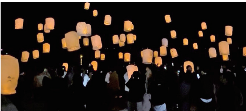
願いを込めてランタンを宙に浮かべた

参加者は、願い事を書いたLEDランタンやしゃぼん玉を一齐に宙に浮かべ、海岸には幻想的な空間が広がりました。 その他、各種ステージやキッチンカーなど飲食の出店も行われ、ビーチは多くの人出で賑わいました。