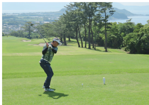
ゴルフを通して親睦を深めた

5月15日(金)、いぶすきゴルフクラブ開闢コースにて、第32回会員親睦ゴルフ大会を開催しました。 当日、はじめは雨が降っておりましたが、徐々に天気も回復し、ゴルフ大会を開催することができました。 41名の参加者は、18ホールストローク・ダブルペリア方式で順位を競い合いながら親睦を深めました。 大会終了後には、会場を焼き鳥あっちゃんに移し、表彰式と懇親会が行われました。 懇親会では、青年部より7月に開催を企画している事業「チャリティーゴルフ」の告