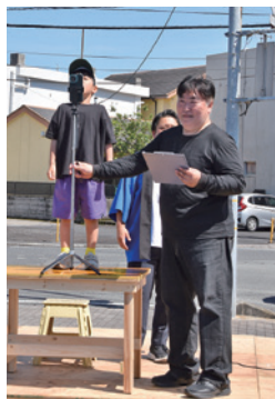
日頃の感謝を叫んだ

声の大きさや内容を基に審査が行われ、入賞者にはプロジェクターや食事券などの豪華賞品が贈られました。 今回は、ハロウィンイベントとして10月下旬頃に開催予定です。