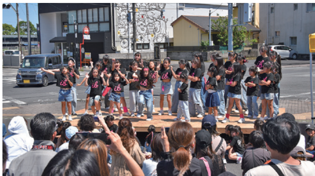
ステージではダンスや和太鼓が行われた