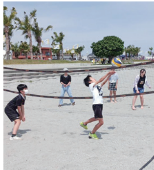
様々な体験会を行った

参加者には成績に応じてお菓子を配布し、子ども達をはじめ多くの市民に体験をしていただきました。