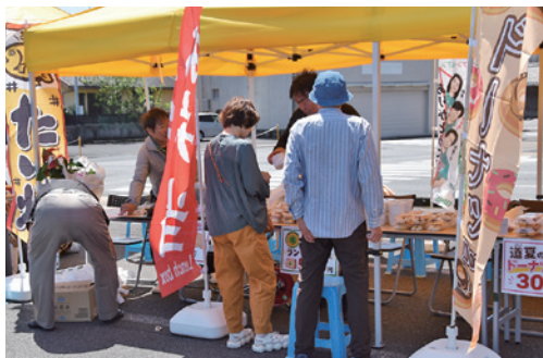
様々な商品が並んだ

昨年同様、母の日での開催ということもあり、ステージから感謝の気持ちを叫ぶ大声大会が行われ、参加者は日頃中々言葉にできていない様々な思いを叫び、感謝を伝えました。