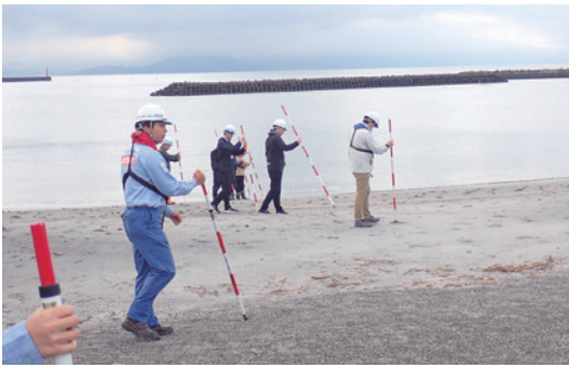
安全点検を行った

今回の点検では特に危険箇所は発見されませんでした。が、国土交通省は「今回の点検で、危険性が確認されなかった箇所でも、気象条件の変化により状況は日々変化します。自然の危険性を理解した無理のない行動をお願いいたします。」と注意を呼びかけました。