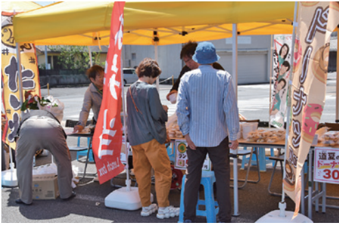
様々な商品が並んだ

昨年同様、母の日の開催ということもあり、ステージから感謝の気持ちを叫ぶ大声大会が行われ、参加者は日頃中々言葉にできていない様々な思いを叫び、感謝を伝えました。