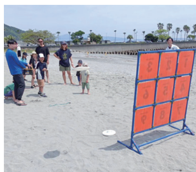
様々な体験会を行った