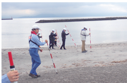
安全点検を行った

4月15日(水)、国土交通省が実施している指宿港海岸の安全利用点検に指宿港海岸保全推進協議会も参加しました。指宿港海岸の利用者が増えるゴールデンウィークの前に利用者が安全に利用できるように毎年実施しています。今回の点検では特に危険箇所は発見されませんでした。国土交通省は、「今回の点検で、危険性が確認されなかった箇所でも、気象条件の変化により状況は日々変化します。自然の危険性を理解した無理のない行動をお願いいたします。」と注意を呼びかけました。