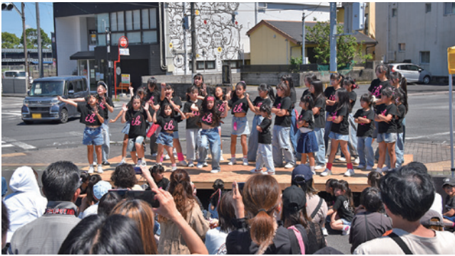
ステージではダンスや和太鼓が行われた