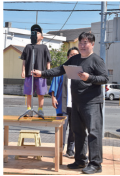
日頃の感謝を叫んだ

声の大きさや内容を基に審査が行われ、入賞者にはプロジェクターや食事券などの豪華賞品が贈られました。 今回は、ハロウィンイベントとして10月下旬に開催予定です。